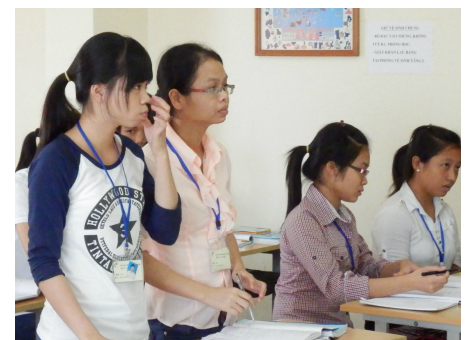
授業を受ける1期生(2013年9月入学)の様子

日本コースにかかる費用はすべて日本国内の医療機関からの出資によるものであり、当事業に参加することによる学生個人の負担はございません。